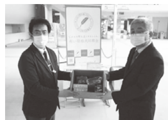
ダイナム福井鯖江店様