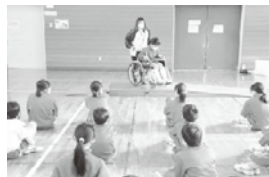
福祉教育の推進事業 (福祉学習)