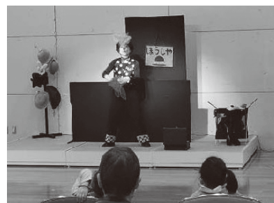
地域ネットワーク推進事業 (子ども交流事業)

弁護士による無料法律相談を月2回開催しています。だれでも悩みを無料で相談できます。