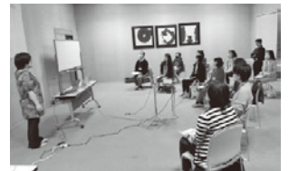
手話奉仕員養成講座

福祉ボランティアの活動支援や、点訳、音訳、手話等のボランティア養成講座、勉強会等を開催しています。