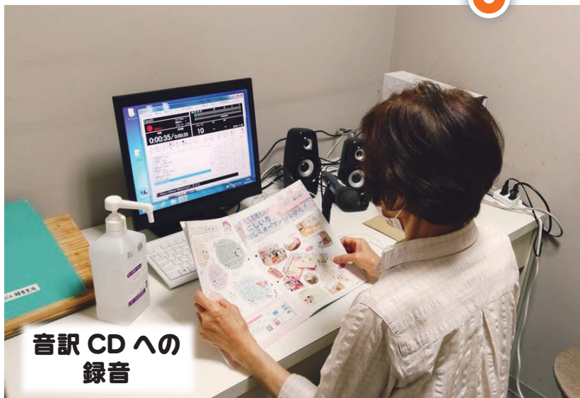
音訳 CD への 録音

新型コロナウイルスの影響でさまざまな活動に制限がかかっているなか、障がいのある方はますます、情報を受け取ることが難しい状況になっています。 鯖江市社会福祉協議会では、視覚に障がいのある方への情報伝達手段として広報誌や新聞のコラム欄を点字・音訳化したものを送付しています。 点字物の発行作業やCDへ録音する音訳活動は、ウイルス対策を徹底したうえでボランティアグループにお願いしています。 これからも少しでも障がいのある方が情報難民にならないように努めていきます。 毎月発行される広報さばえなどの音訳CDや点字物をご希望される方は、鯖江市社会福祉協議会にご相談ください。