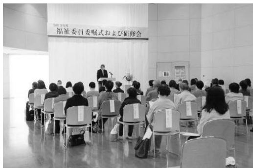
ソーシャルディスタンスを取りながらの委嘱式

コロナ禍であることもあり、短時間での説明会になってしまいましたが、その分集中して聞いていただいたように感じられました。