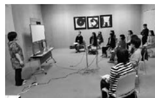
手話奉仕員養成講座

福祉ボランティアの活動支援や、点訳、音訳、手話等のボランティア養成講座、勉強会等を開催しています。