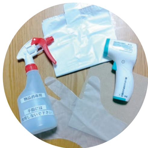
ウイルス対策で徹底消毒