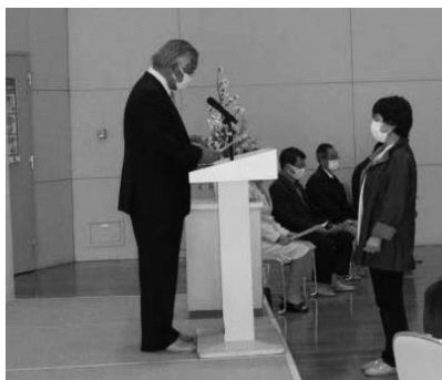
委嘱状は地区代表に

今後は、各地区・町内に分かれて実際の活動が始まりますが、単独ではなく民生委員児童委員と連携して地区に根ざした活動に取り組まれます。その際にも、現在のコロナ禍の状況に応じた形での活動となります。