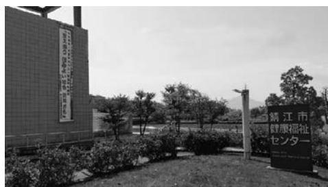
アイアイ鯖江の東西の壁面にも「民生委員の日」懸垂幕を設置

地域住民の方々の身近な相談相手として、民生委員・児童委員は厚生労働大臣に委嘱されて、活動を行っています。特に5月12日から18日は民生委員児童委員の活動強化週間です。 この期間中に、災害時の避難に支援を必要とされる方を対象として、現況を把握するため、訪問活動をする予定でしたが、新型コロナウイルス感染症の拡大に伴い、期間を延期して実施させていただきます。 今後高齢化が進み、支援要望が多様化するなかで、地域一体となった支援の取り組みが求められます。地域住民の方々に、民生委員児童委員の活動を理解していただくための取り組みとして、公民館に民生委員児童委員