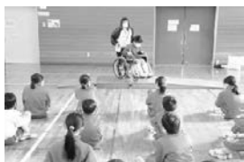
福祉教育の事業 (福祉学習)