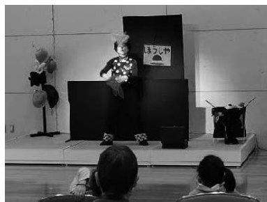
地域ネットワーク推進事業 (子ども交流事業)