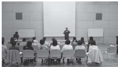
《手話奉仕員養成講座》

福祉ボランティアの活動支援や、点訳、音訳、手話等のボランティア養成講座、勉強会等を開催しています。