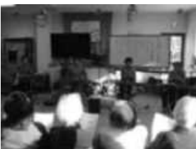
さまざまなボランティア活動の場

高齢者も障がい者(児)も、お互いに共生し、支え合う「なかま」となることを期待し、利用者皆さんはもちろん、市民の皆さんに愛される施設となるよう日々努力しています。