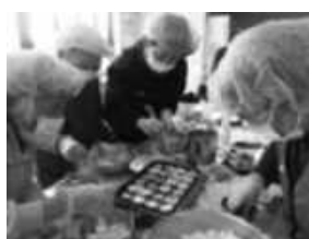
楽しいたこ焼きづくり