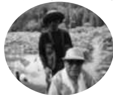
お出かけ(花ハス公園)